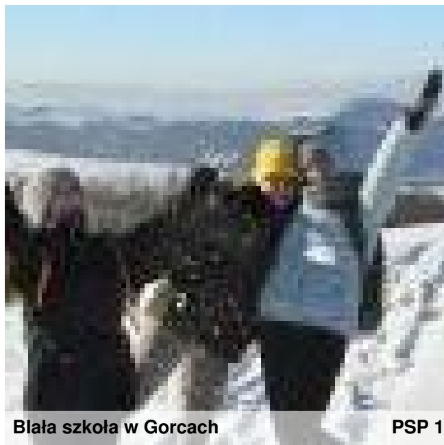
Biała szkoła w Gorcach