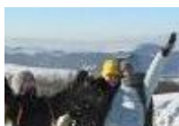
Biała szkoła AG